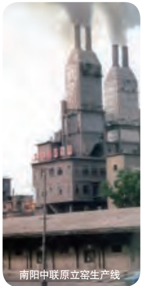
南阳中联原立窑生产线