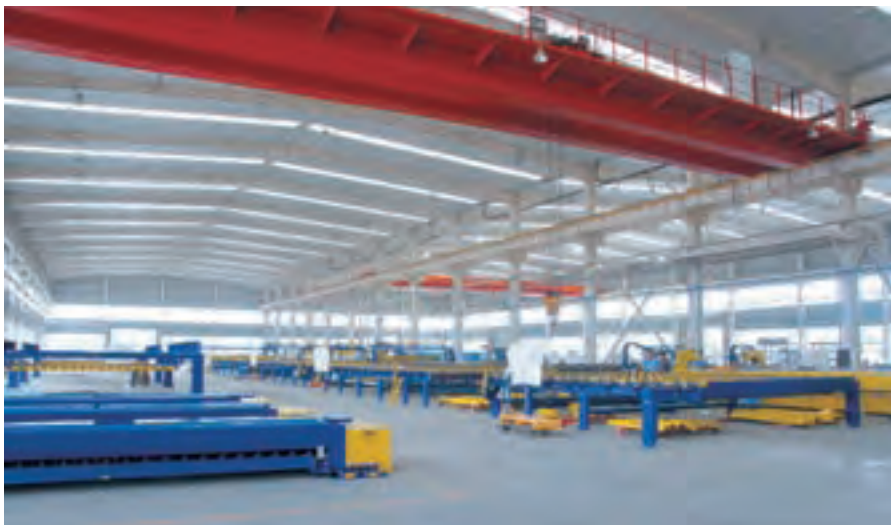
中国建材玻璃装备生产基地内景

1、完善自主创新体系，不断提升核心竞争力。近年来，公司整合机构、资源和人才优势，按照主业要求和课题组模式规范研发组织体系，推行首席科学家制，建立健全一系列激励和约束机制，着力培养一批科技创