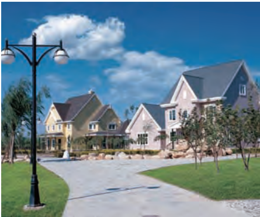
中国建材集团推出的薄壁钢管住宅体系,建设节能省地型住宅

际化水平;三是研究对策,强化管理,提高防控风险能力;四是积极抓住机遇,逐步加快境外工程投资一体化步伐。另一方面,我们积极响应党和政府的号召,积极采取措施扩大内需。外需损失内需补,寻找新的效益增长点,为拉动内需作贡献。一是抢抓4万亿扩大内需的机遇,抓大订单,大项