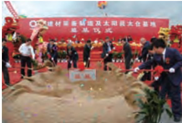
中建材装备制造及太阳能太仓基地隆重奠基