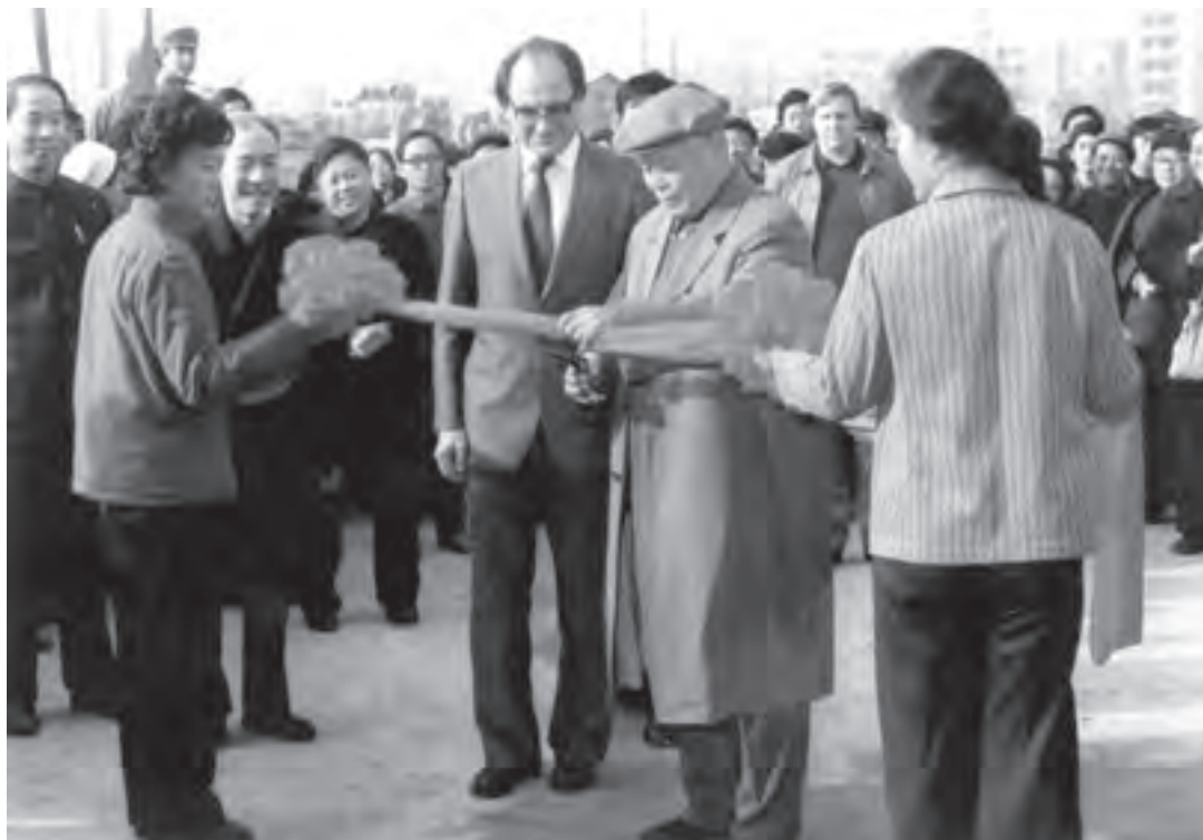
1979年时任建材部副部长祁俊同志在北京新型建筑材料试验厂开工仪式上剪彩

如今，小平同志已经离开我们12年，许多支持、热爱并献身于新型建材的老同志也已经走了。但绿色建材、可持续发展的环保建材事业正方兴未艾。小平同志的指示我们没有辜负。