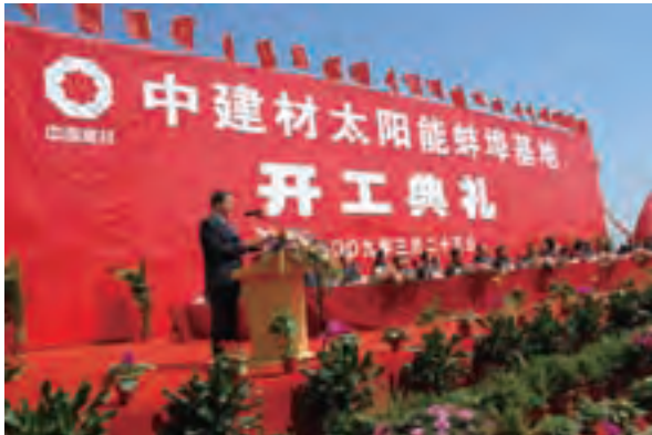
中建材太阳能蚌埠基地隆重开工