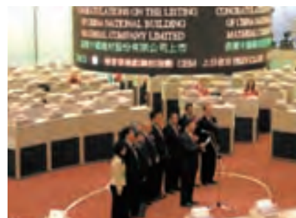
中国建材:按市场法则与价值规律快速成长