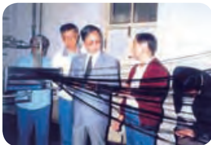
原国家建材局局长张人为视察工作，来到预浸车间。