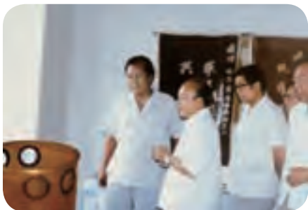
原国家建材部部长林汉雄来哈玻院视察。