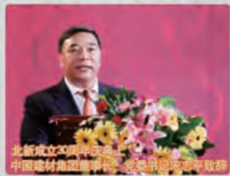
北新成立30周年庆典上 中国建材集团董事长宋志平致辞