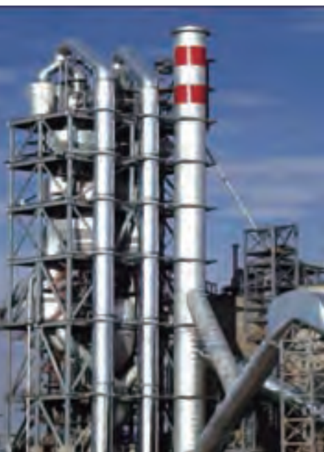
合肥院承建沙特纳吉兰6000t/d 水泥熟料生产线预热器分解炉