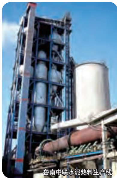
鲁南中联水泥熟料生产线