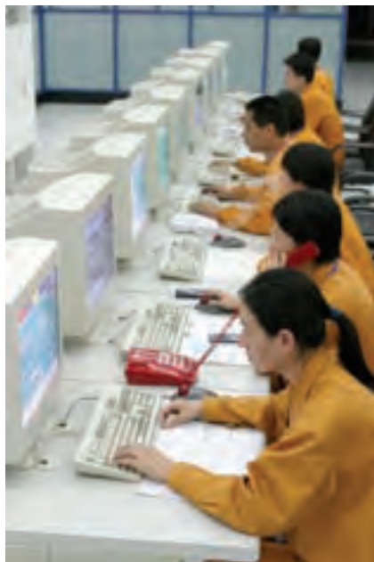
鲁南中联中央控制室

三、1955年5月,国务院发出了关于加强和发展建筑材料工业的决定,迎来了中国建材工业发展的新纪元。 特别是改革开放30年来,我国建材工业的发展坚持以邓小平理论、“三个代表”重要思想为指导,深入贯彻落实科学发展观,以服务于国民经济建设和提高人民生活水平为己任。在党中央的正确领导下,历届建材行业主管领导部门和地方各级党委、政府谋划产业布局,规划发展蓝图,引领行业解放思想,锐意改革,开拓进取,先进生产力获得极大发展,产业结构不断优化,体制不断创新,活力不断增强,使我国建材工业彻底告别了产品短缺、工艺落后、装备陈