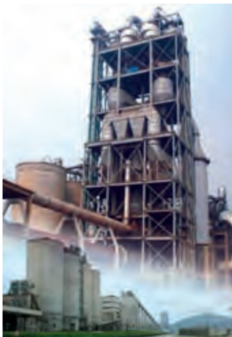
日产10000吨熟料生产线

公司荣获“2006年度中国信息化百强企业”、第十三届省级一等企业管理现代化创新成果奖，徐州市科技进步一等奖，全国建材行业企业管理现代化创新成果二等奖，中国建筑材料工业协会·中国硅酸盐学会建筑材料科学技术三等奖荣誉称号，获国家版权局授予的计算机软件著作权两项，公司工会被江苏省总工会评为“江苏省群众性经济技术创新工程先进单位”。