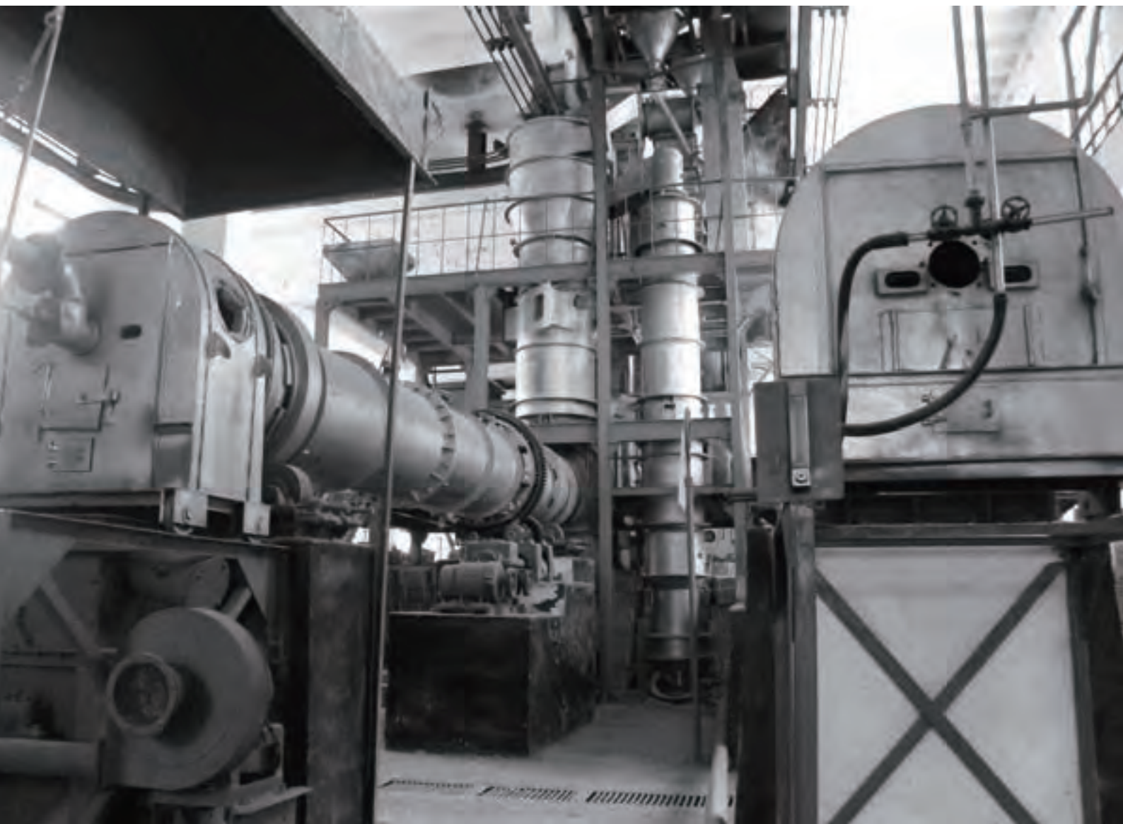
中国建材院预分解窑试验线