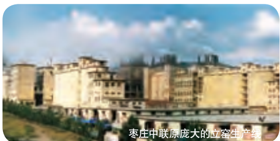
枣庄中联原庞大的立窑生产线