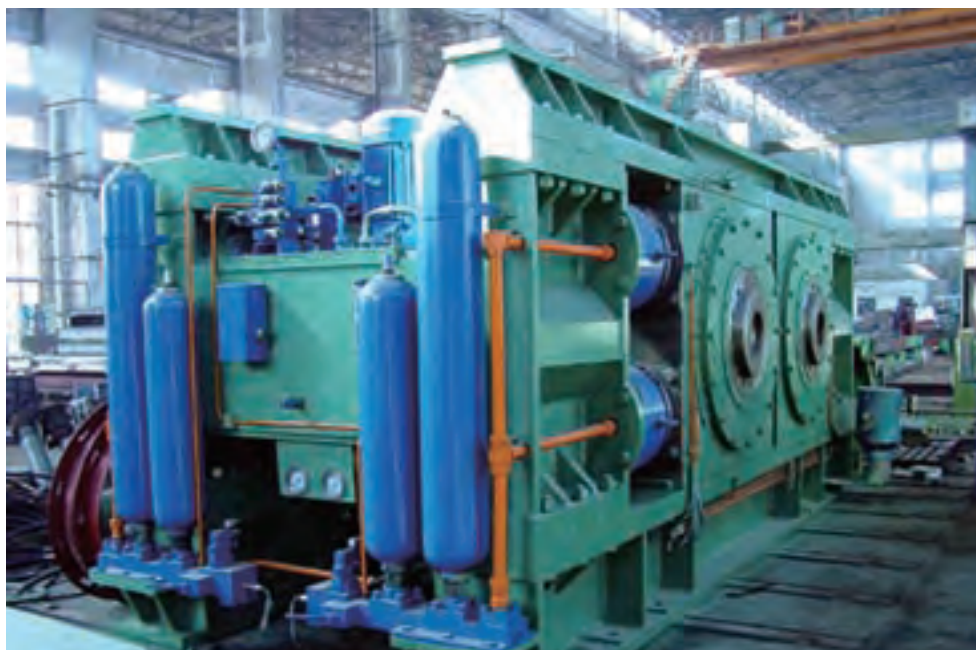
合肥院承建用于浙江红狮集团5000t/d水泥熟料生产线的辊压机

术，成功完成了6000t/d及以下不同生产规模的水泥生产线设计数百条，取得了突出的业绩，树立了良好的形象。