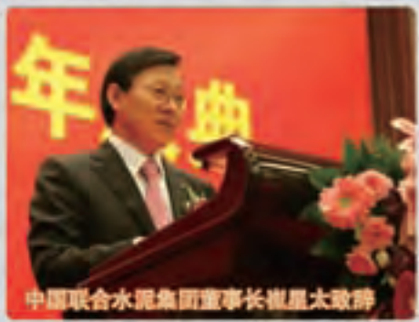
中国联合水泥集团董事长崔星太致辞