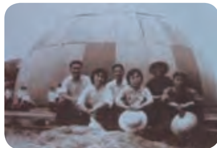
1975年，哈玻院研制的第一部玻璃钢雷达天线罩及部分工作人员。