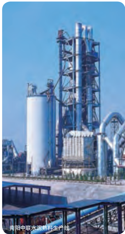
南阳中联水泥熟料生产线