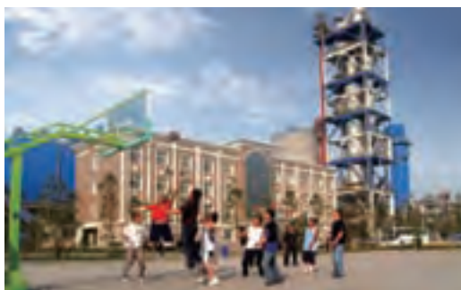
南阳卧龙中联外景

“深入学习实践科学发展观，履行社会责任”的奉献史。中国联合水泥始终遵照科学发展观的要求，大力发展循环经济，坚定不移地走新型工业化道路。到目前为止，所有具备条件的水泥熟料生产线全部配套建设纯低温余热发电机组，总装机容量达229.2MW，每年可节约标煤50万吨、减少二氧化碳排放125万吨；同时，通过优化工艺流程，调整生产配方，每年在水泥生产过程中消纳工业废弃物960余万吨。