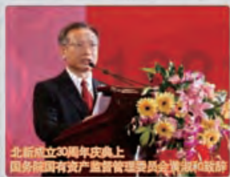
北新成立30周年庆典上 国务院国有资产监督管理委员会黄淑和致辞