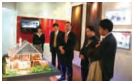
北新的明天更美好