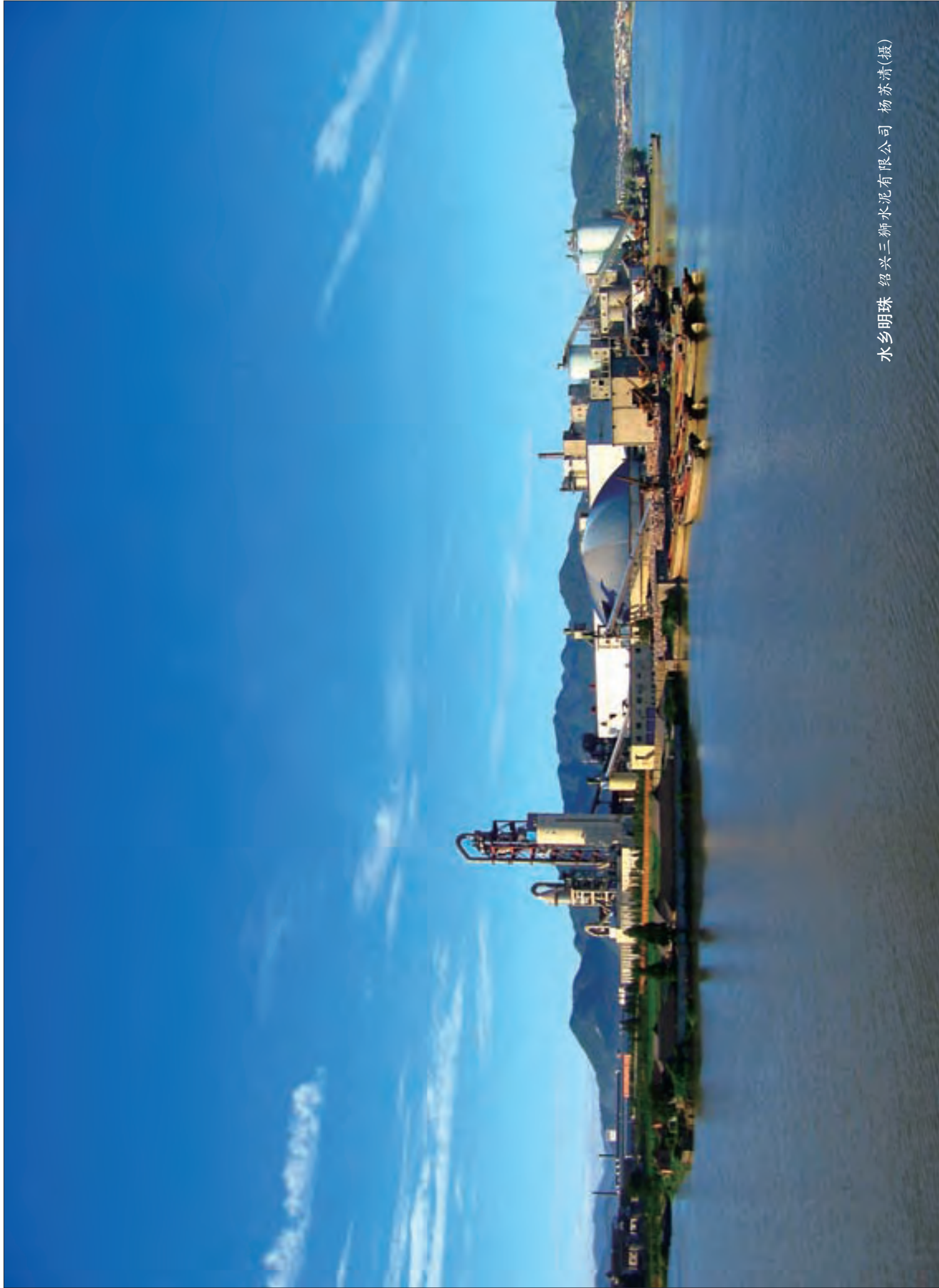
水乡明珠 绍兴三狮水泥有限公司