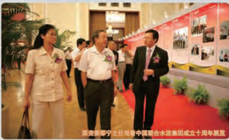
国资委邵宁主任观看中国联合水泥集团成立十周年展览