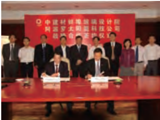
蚌埠院与阿波罗公司共同打造太阳能产业基地