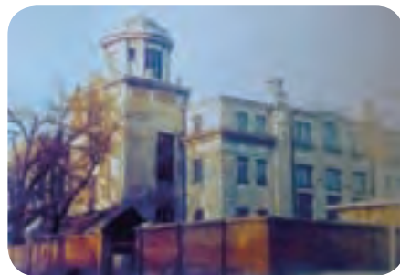
1961年3月，哈尔滨建工学院玻璃钢研究室承担了“两弹一星”急需的配套任务，研制玻璃钢端头。

1960年为适应当时形势需要，哈尔滨建筑工程学院（后合并入哈尔滨工业大学）在国家科委、建工部指导下组建了玻璃钢研究室，形成了哈尔滨玻璃钢研究院的前身。