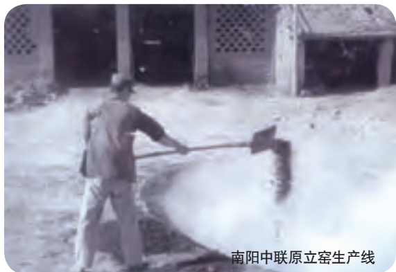
南阳中联原立窑生产线