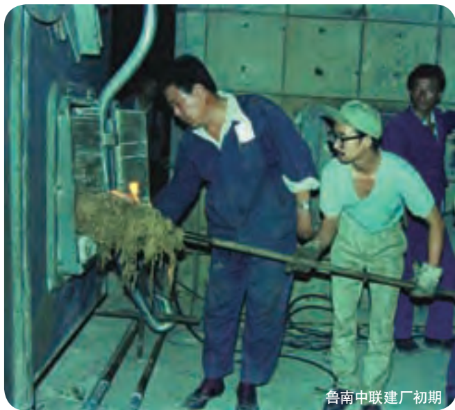
鲁南中联建厂初期