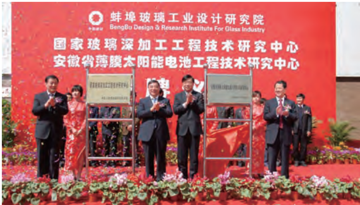
国家玻璃深加工工程技术研究中心安徽省薄膜太阳能电池工程技术研究中心在蚌埠隆重揭牌

一次次走出国门的成功合作，不仅在世界舞台上展示了中国技术的魅力，也为国家创造了财富，“凯盛”品牌的影响力、竞争力和美誉度、忠诚度得到了大幅提升。2009年公司第4次蝉联上海市实施“走出去”战略先进企业，位列第4名；“凯盛”被评为安徽省十大强省品牌。