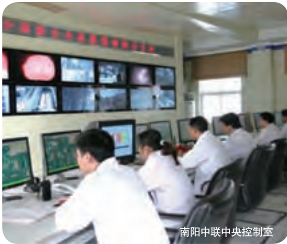
南阳中联中央控制室