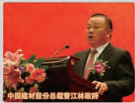
中国建材股份总裁曹江林致辞