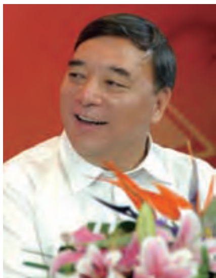
宋志平：科学发展是企业发展的新动力