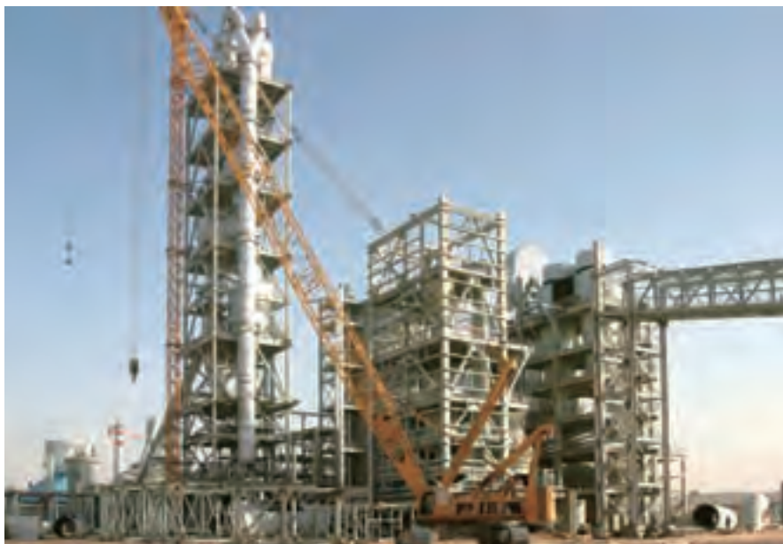
海外水泥项目建设工地

水泥市场是一个大的系统，只有系统健康了，每个个体才能健康发展。所以我们着眼于把系统健康化，让系统良性化。去年中国建材在浙江和山东的市场协同就做得非常好，不只是中国建材系统内的企业协同，我们还与区域内其他企业协同，使水泥市场的价格得到恢复性上涨，特别是在去年下半年受金融危机影响，浙江许多中小企业生存困难的情况下，浙江的水泥企业没有出现大的问题，证明市场协同起了重要作用。