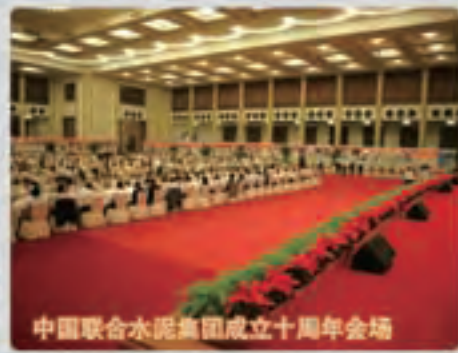
中国联合水泥集团成立十周年会场