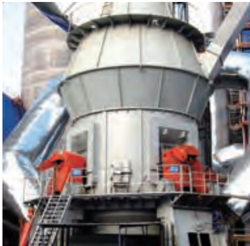
合肥院承建浙江虎山集团5000t/d水泥熟料生产线大型原料立磨

另一方面，合肥水泥院大力开拓国际市场，以工程总承包为载体，带动科研、设计、产业的快速发展和管理水平的不断提高。2005年，合肥水泥院承接了沙特纳吉兰6000t/d总承包项目，这是当时国内规模最大的水泥出口项目，也是沙特国内最大的水泥生产线工程。自此合肥水泥院在国际市场的发展势如破竹，先后在亚洲、非洲、美洲和中东等地区承接了越南、苏丹、沙特、智利、印尼、埃塞俄比亚、俄罗斯等17个总承包工程。其中拉法基项