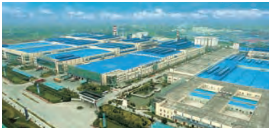
年产60万吨玻璃纤维池窑拉丝生产基地

形势之后做出的决策。建材行业是规模经济产业,做强必须首先做大。中国建材行业集中度低,竞争无序,科技含量不高,盈利能力弱。在新的发展时期,建材产业面临着三大历史性机遇。一是党中央、国务院提出加快建设节约型和环境友好型产业;二是我国建材行业正经历通过战略性资源整合