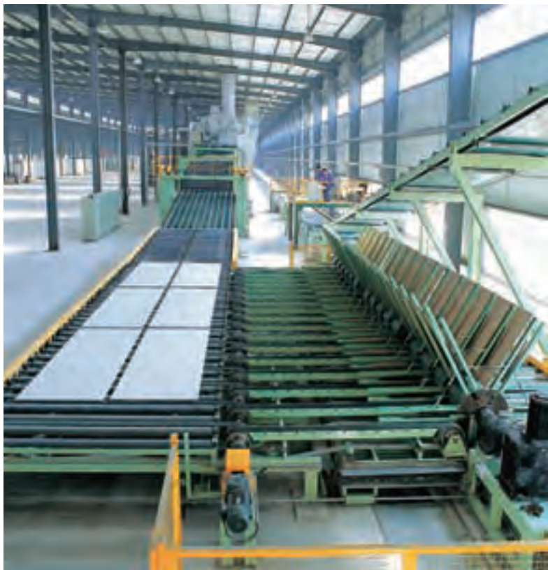
年产30万平方米纸面石膏板生产线