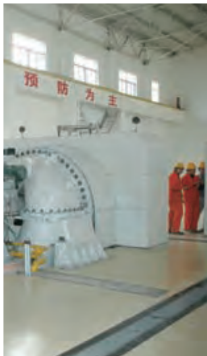
纯低温余热发电机组

2009年7月28日，“2009年南京工业大学淮海中联教学点研究生毕业典礼暨学位授予仪式”在徐州隆重举行。至此，淮海中联已经获得硕士学位学历和在读硕士以上人员总数达52人，占公司员工