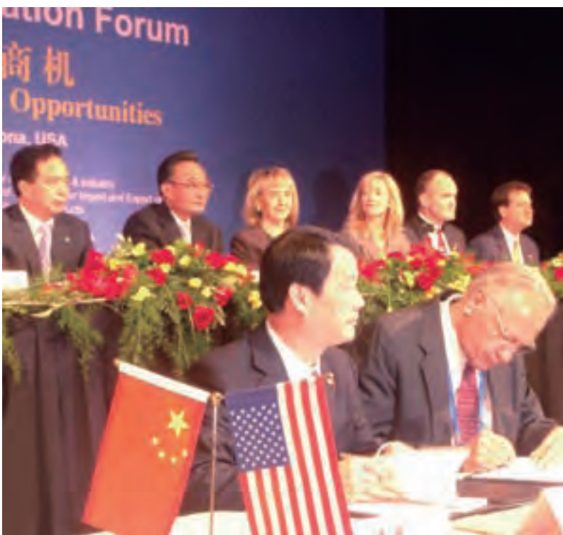
彭寿院长陪同吴邦国委员长访问美国

近60年来，蚌埠院获得省部级以上科技成果奖励近200项，拥有专利技术近100项，并成功组建了国家重点实验室、国家玻璃深