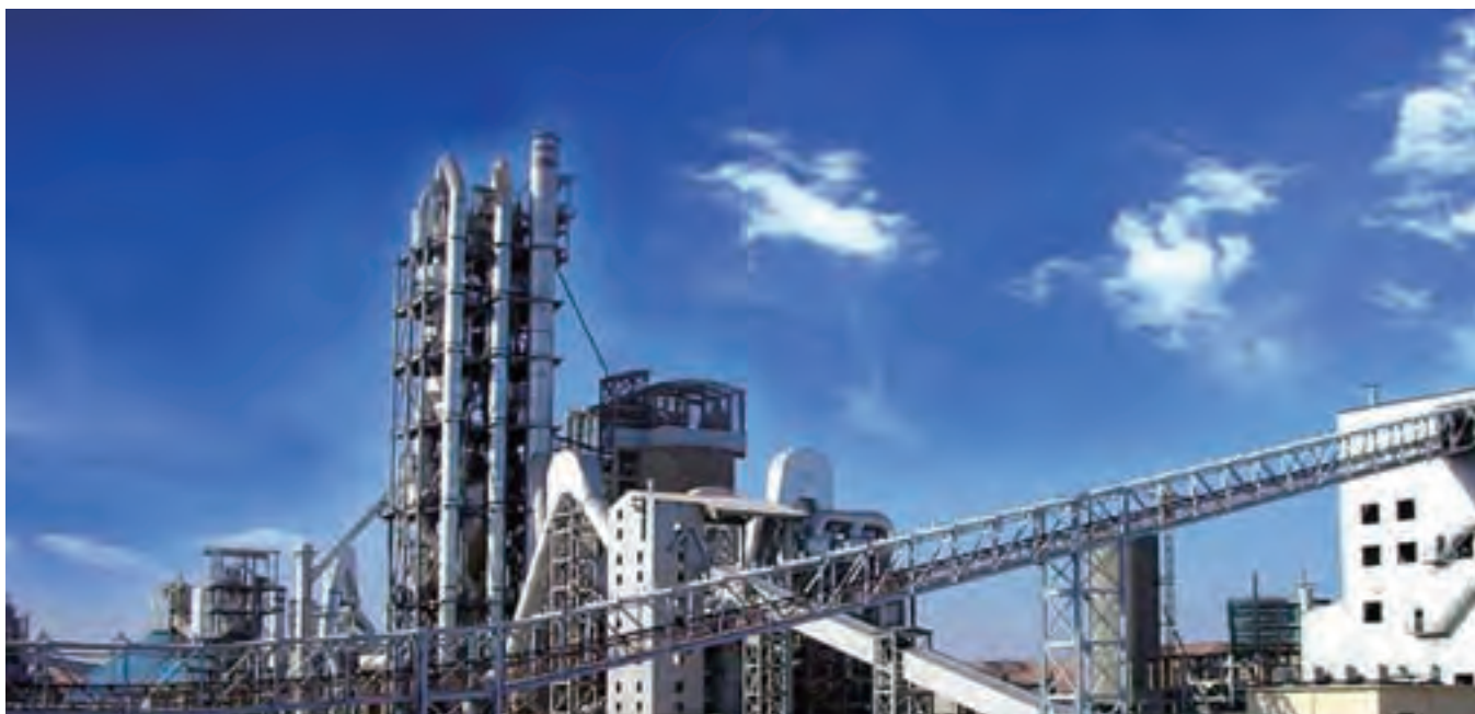
合肥院承建的沙特纳吉兰6000t/d水泥熟料生产线