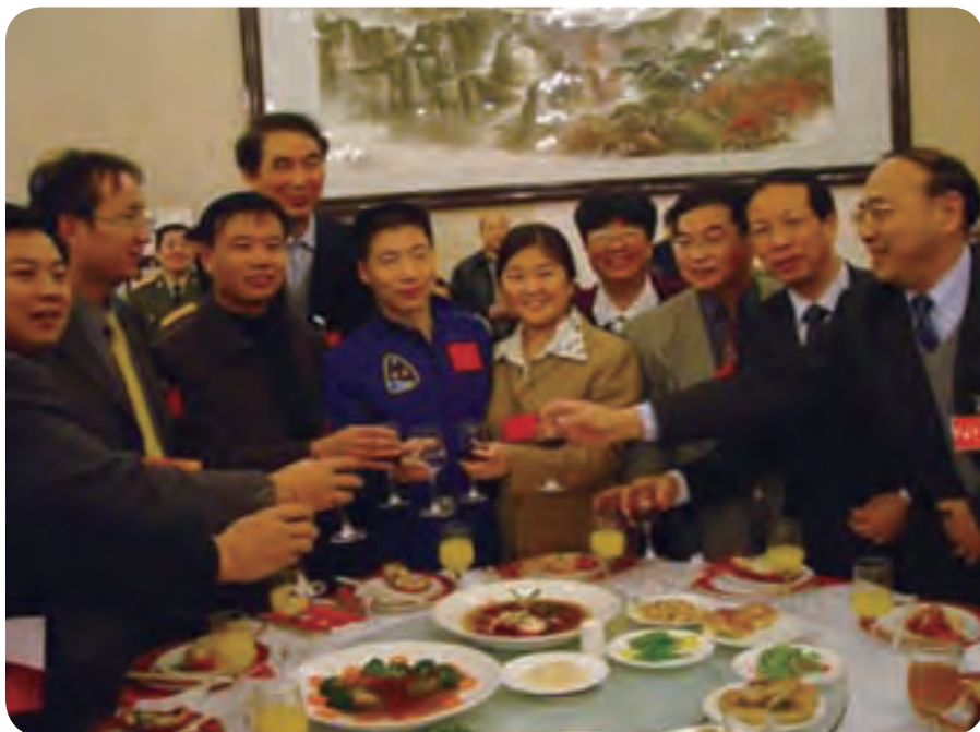
哈玻院院长陈辉和航天英雄杨利伟，在“神五”庆功会上合影。