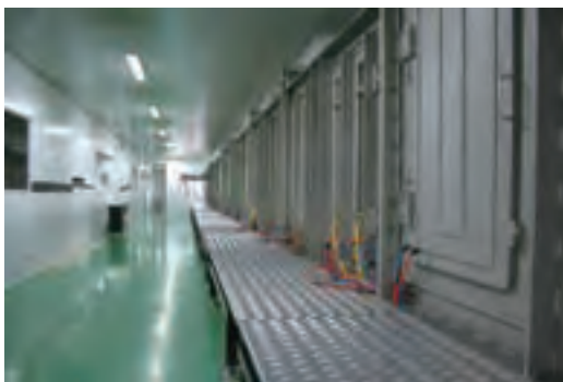
华光集团华益导电膜玻璃公司成为我国生产规模最大、开发能力最强、品种结构最完善的ITO导电膜行业的领军企业

在严峻的形势面前，新的华光集团领导班子坚定了国有企业可以搞好的信心，以科学发展观为指导，确定了“转机建制、精细管理、走出困境、二次创业”的发展思路，推进战略转型，使企业由一个包袱沉重、机制滞后、缺乏竞争力、濒临破产倒闭的企业脱胎换骨成为资产质量较好、治理结构完善、竞争力