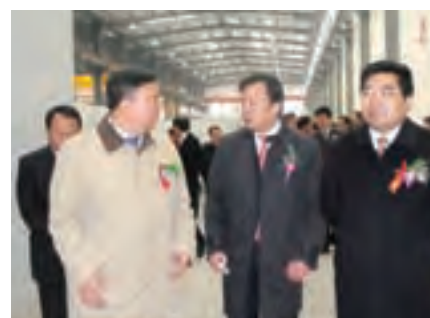
深刻认识市场规律 提高企业发展能力 实现洛玻扭亏增盈与战略转型