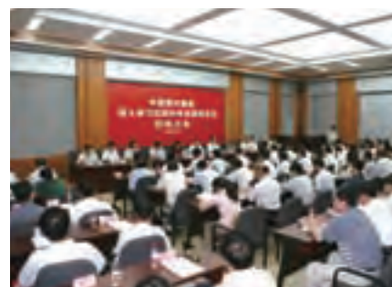
巩固扩大学习实践活动成果 推进集团公司更好更快发展