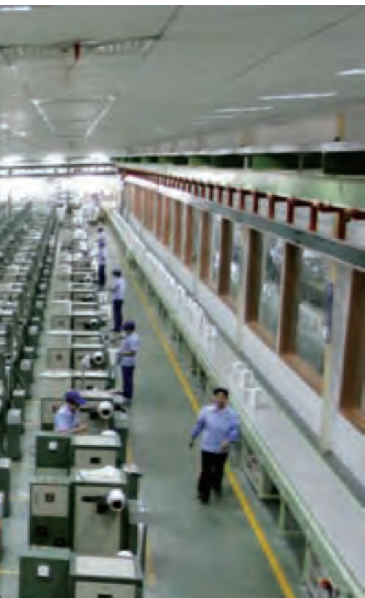
玻璃纤维生产络纱区

转变那种单纯依靠增加产能来达到企业规模增长的成长模式,代之以通过延伸产业链和提高水泥产品的附加值来实现企业效益的提升,变过去数量的增长为价值的增长,提升行业整体价值,使水泥企业赚到合理利润,成为水泥行业的重要着眼点。在这一过程中,大企业集团应该用自