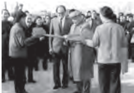
三十年前难忘的事