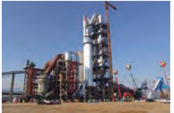
总承包的青州12000t水泥熟料生产线

加工工程技术研究中心、科技部国际科技合作基地、安徽省薄膜太阳能工程技术研究中心、安徽省玻璃新材料工程技术研究中心等多个行业科研机构。2009年，企业领头人彭寿当选为新一届国际玻璃协会执委会副主席，成为进入国际玻璃协会最高5人管理层的中国第一人。