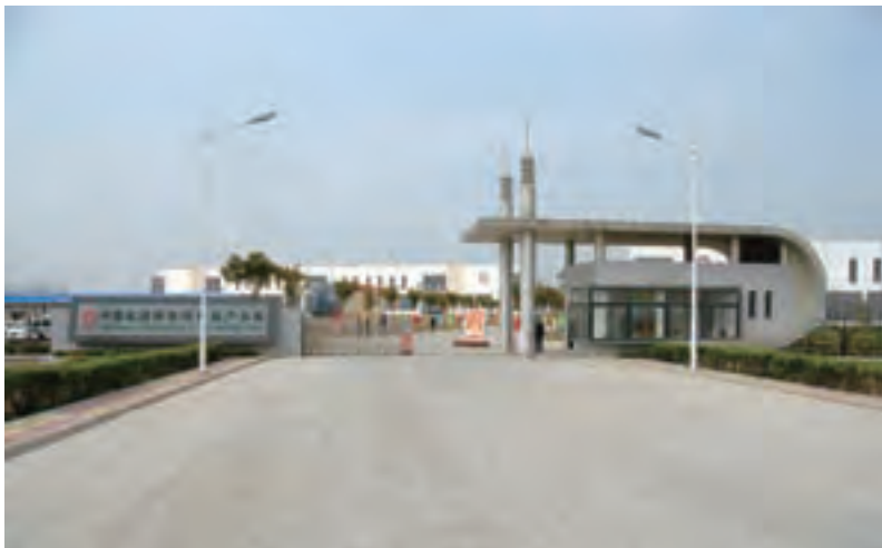
加速发展的中国玻璃新材料科技产业园

60年，一个甲子。已经取得辉煌成就的中国建材工程和蚌埠院，将在中国建材集团公司“集成化、工程化、产业化、国际化”发展战略的指引下，继承老一辈艰苦奋斗、开拓创新、辉煌发展的历程，为实现国际一流的科技型企业集团的目标，在打造“百亿集团、百年老店”的征途上，为我国民族建材工业的发展做出更大的贡献。