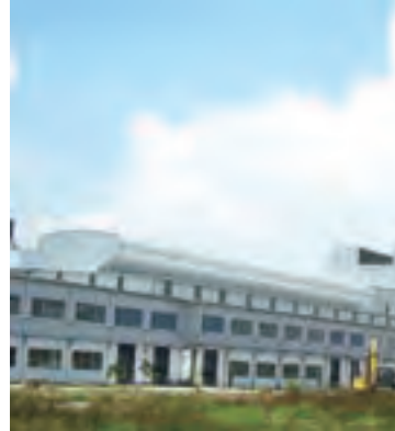
总承包的印尼900t浮法玻璃生产线

璃厂一号窑进行了成功改建，成为中国历史上依靠国内力量建设的第一座当时的大型玻璃熔窑。1971年，“文化大革命”将玻璃工业设计院分解、下放，一支队伍从北京来到蚌埠，成为了今天的蚌埠玻璃工业设计研究院。