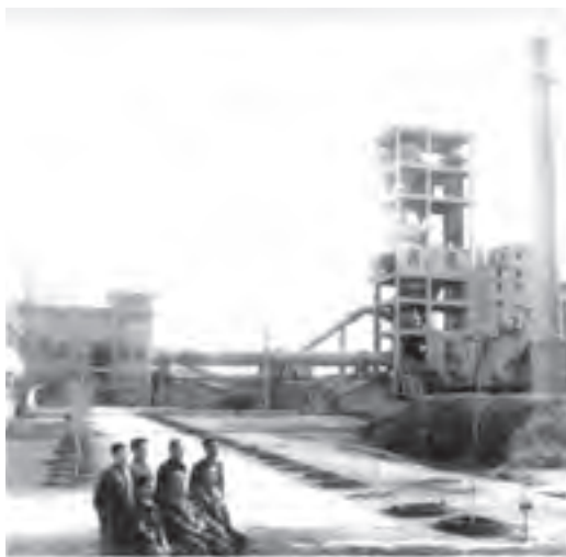
我国第一台水泥预分解窑生产线1976年在吉林四平竣工